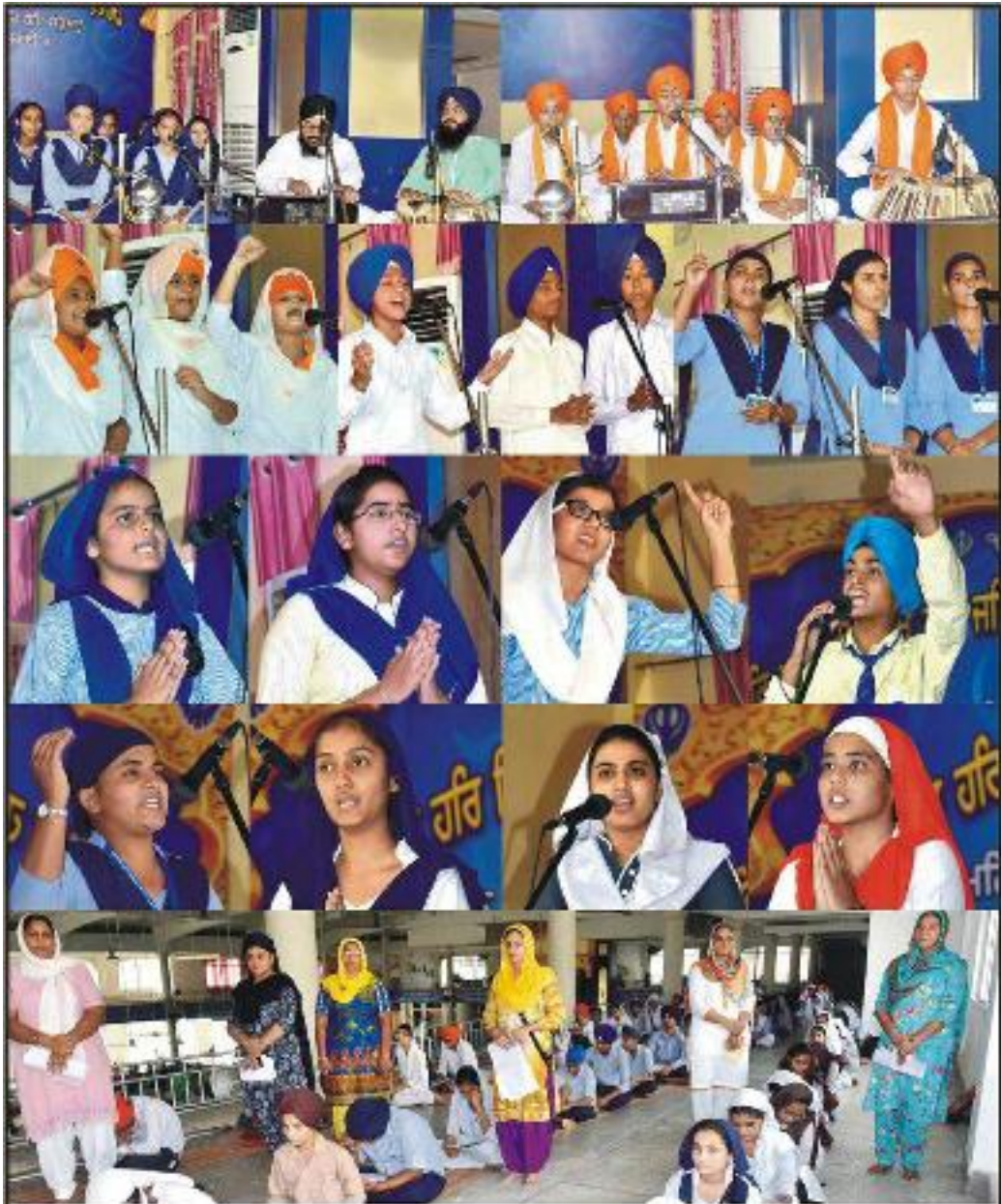
ਸ੍ਰੀ ਗੁਰੂ ਰਾਮਦਾਸ ਜੀ ਦੇ ਪ੍ਰਕਾਸ਼ ਪੂਰਬ ਨੂੰ ਸਮਰਪਿਤ ਗੁਰਦੁਆਰਾ ਸ੍ਰੀ ਮੰਜੀ ਸਾਹਿਬ ਦੀਵਾਨ ਹਾਲ ਵਿਖੇ ਕਰਵਾਏ ਫਏ ਰਾਕਾਂ 'ਤੇ ਅਧਾਰਿਤ ਸ਼ਬਦ ਕੀਰਤਨ, ਕਵੀਬਰੀ, ਭਾਸ਼ਣ ਅਤੇ ਸਿੱਖ ਇਤਿਹਾਸ ਤੇ ਲਿਖਤੀ ਮੁਕਾਬਲਿਆਂ ਵਿਚ ਹਿੱਸਾ ਲੈਂਦੇ ਹੋਏ ਵੱਖ-ਵੱਖ ਸਕੂਲਾਂ ਦੇ ਬੱਚੇ।